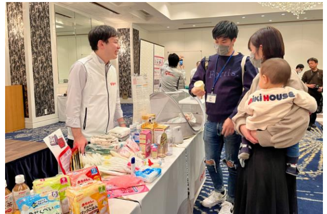
▲「赤ちゃんのための3日分の備蓄品」展示