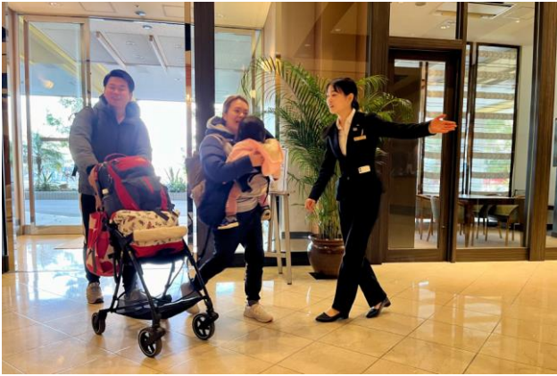
▲自宅からホテルまで避難する「子連れ避難」