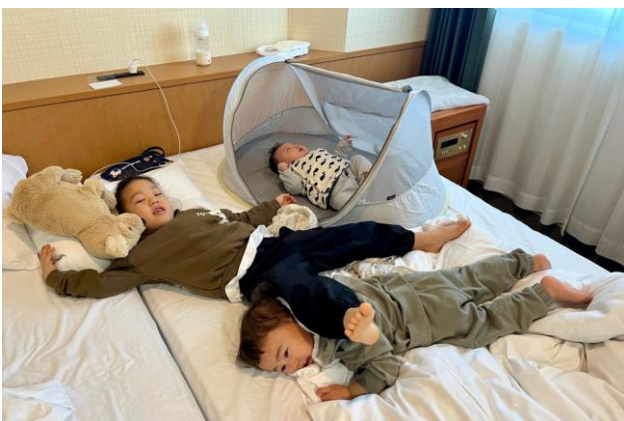
▲避難所で1泊2日の宿泊体験