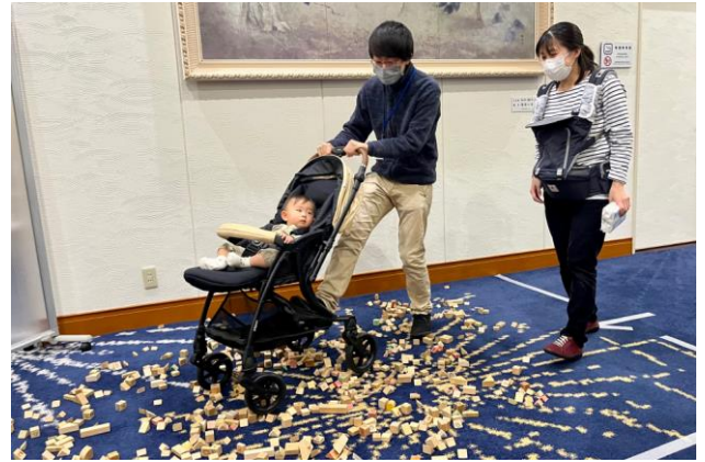
▲ガレキ道のベビーカー体験