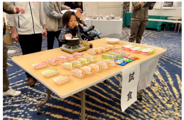
▲災害食の試食コーナー