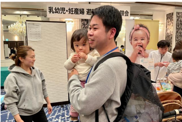
▲赤ちゃんを抱え避難用リュックを体験