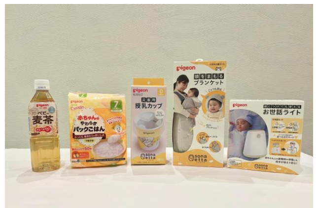
▲あかちゃんの防災グッズを協賛品提供