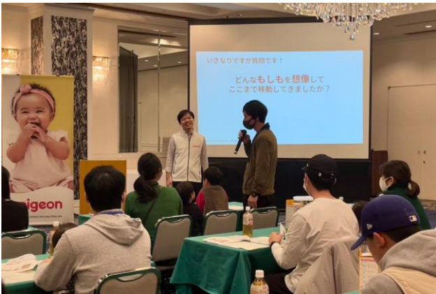
▲子育て講座「あかちゃんの防災を学ぼう」